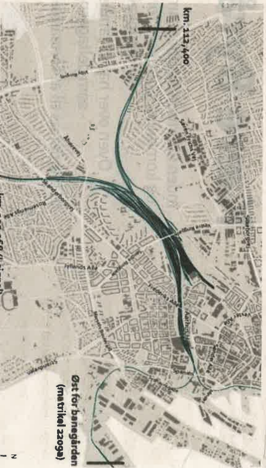
Kortet her viser den del af jernbanen, der skal elektrificeres i forbindelse med ombygningen af Aarhus H. Fælle naboer til jernbanen sig så generet af støj fra for eksempel nedramning af kørebaner, skal de klage til Transportministeriet, der i den grad er part i sagen. For det er Transportministeriet, der står for elektrificeringen af banen. Kort: Transportministeriet